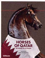
Vanessa von Zitzewitz: Horses of Qatar. teNeues, 98 Euro