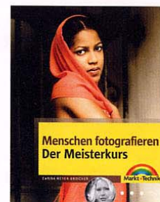
C. Meyer-Broicher: Menschen fotografieren. Markt und Technik, 39,95 Euro